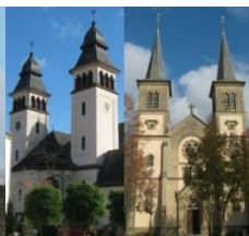
Parverband Mäertert- Waasserbëlleg