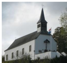
Parverband Gréiwemaacher (Maacher)